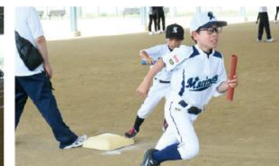
フォーサイドランリレー