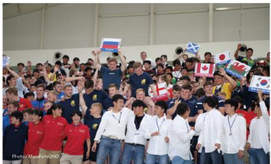
ワールドラグビーユース交流大会

的な光景でした。スポーツで世界平和は達成できると思いました。 また、一番苦労された事はなんですか？ 国際大会では各国文化、宗教、習慣の違いによりちよつとした理解の違いが問題になることがありました。スポーツは言葉や習慣が違っても同じルールで戦うことができるので素晴らしいツールですが、生活となるとどうしても異なることがあります。でもこれも国際大会を行う目的でもあります。若いうちから異文化を知ること視野や他者理解が広がりますし、将来に必ず役立ちます。