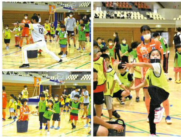
福岡ソフトバンクホークスによる野球体験教室