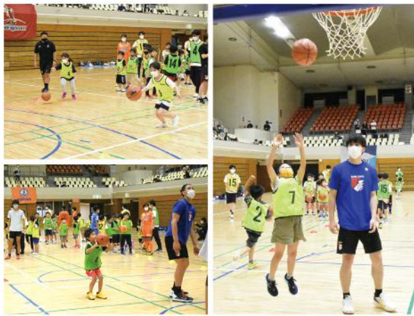
ライジングゼファーフクオカによるバスケットボール体験教室