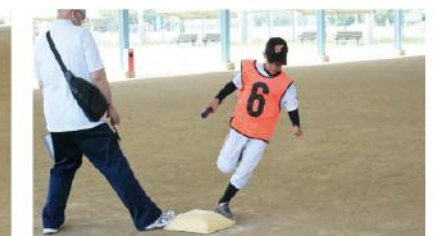
フォーサイドランリレー