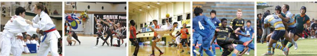
サニックス旗 福岡国際中学生柔道大会 サニックスCUP 国際新体操団体選手権 サニックスカップU-17 国際ハンドボール交流大会 サニックス杯 国際ユースサッカー大会 サニックス ワールドラグビーユース交流大会