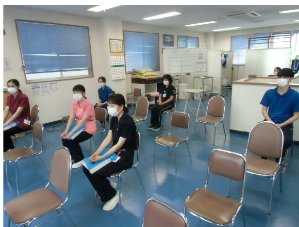
第1回フォローアップ研修の様子

8/26に第1回フォローアップ研修を行いました。リフレッシュ研修の中止により、数少ない新人同士の交流となりました。まず、二人一組になってお互いの自己紹介を行い、その後、相手の紹介をみんなの前で行いました。今まで知らなかった意外な一面を知ることが出来ました。